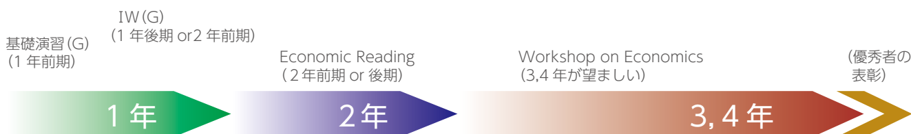
図1. 新設した少人数ゼミナール履修の流れ

IW(G), Workshop on Economicsや専門演習3,4では、海外大学との合同ゼミやフォーラムにおけるプレゼンや議論の実践を推奨します。具体的には、吉林大学(中国)と全南国立大学(韓国)とのフォーラムは学生間の学術交流を重点的に行います。さらに、De La Salle University, Philippinesとの合同ゼミなどを想定する。また、海外大学との教員間の研究交流も合わせて進めていきます。